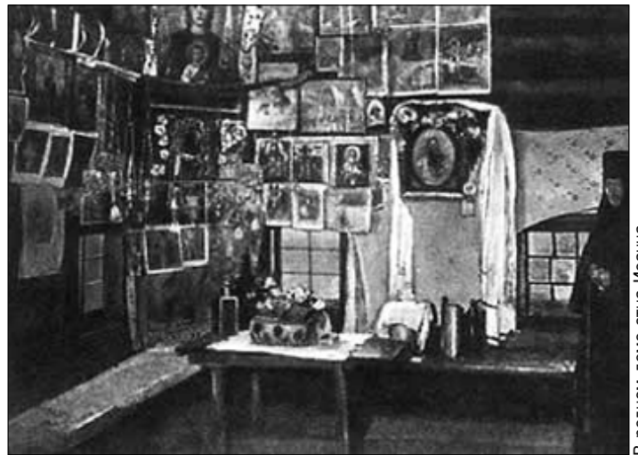
В родном доме отца Иоанна.

Итак, с одной стороны — красота, суровое, нетронутое величие, с другой — нужда, вот «фон» первых впечатлений Вани Сергиева. Но дело в том, что при благодати Божией эта суровая и красивая природа да нужда и бедность, вместе с сильным и благотворным влиянием отца и матери, создали нам кронштадтского молитвенника.