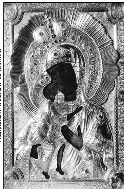
Феодоровская икона Божией Матери. XVII в.

27 марта — Феодоровской иконы Божией Матери.