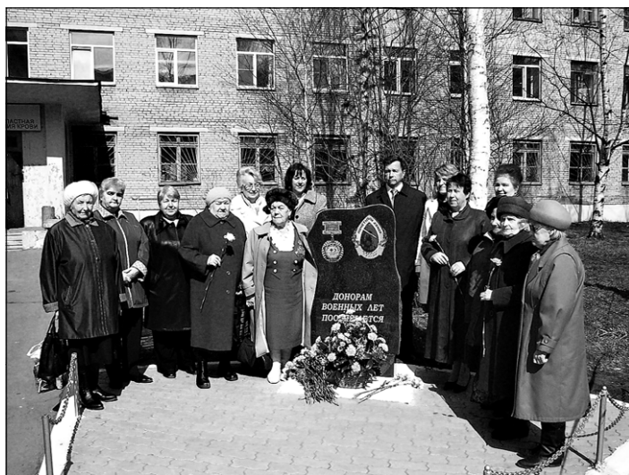
Встреча с донорами военных лет.