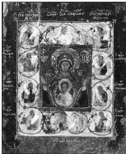
Икона Божией Матери «Знамение» Курской-Коренной. XII в.

Она за нас, грешных, Поручительница. На иконе Богородица левой рукой держит Божественного Младенца, Который обеими ручками Своими сжимает правую руку Богоматери. Это как соглашение. В углах иконы написано: «Аз Споручница грешных к Моему Сыну; Сей дал Мне за них руце слышати Мя...». Сколько утешения верующим в словах, что Христос «дал руце» — заверил Богородицу, что будет внимать Ее мольбам за грешных.